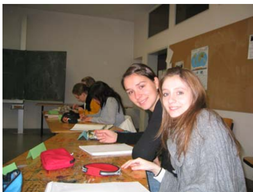
Profesoras en prácticas como dos alumnas más.