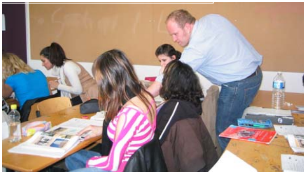
Dos profesores en prácticas impartiendo clases en equipo.