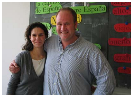
Profesores en prácticas después de dar clase conjuntamente.